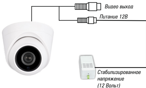
Рис.1 Схема подключения